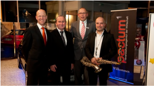
Besuch der Aufführung von „Hilfe, die Herdmanns kommen“ im Autohaus Schmidt und Koch am 9. Dezember 2010