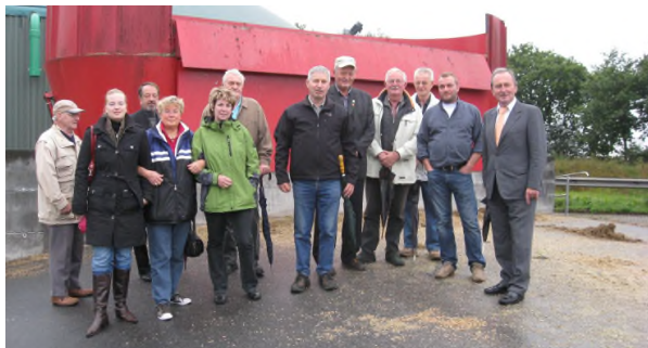
Mitglieder der CDU Friedeburg