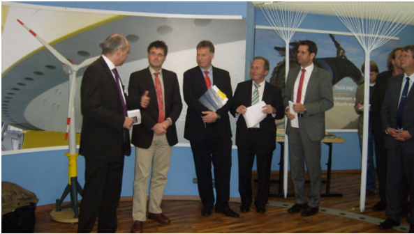
Ausstellungseröffnung „Faszination Offshore“ in Varel