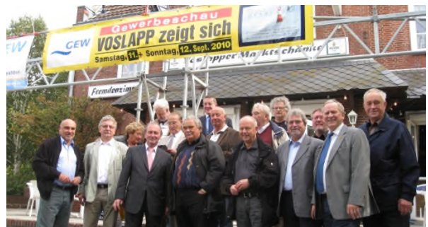
Eröffnung der 11. Gewerbeschau "Voslapp zeigt sich"