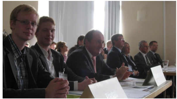
Mitgliederversammlung der JU Wilhelmshaven