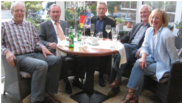
Stammtisch der CDU Varel