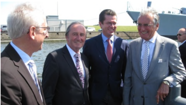
von links: Heinrich Peter Sondermann, Leiter des Arsenal, Hans-Werner Kammer MdB, Minister Guttenberg und Uwe Biester MdL

(28.07.2010) Hohen Besuch empfing die Stadt Wilhelmshaven am 28. Juli 2010. Bundesverteidigungsminister Karl-Theodor zu Guttenberg besichtigte im Rahmen seiner Sommertour den Marinestützpunkt und das Arsenal. Im Mittelpunkt der Gespräche stand die Strukturreform der Bundeswehr und ihre Auswirkungen auf die Marine, insbesondere den Standort Wilhelmshaven. Die Strukturreform soll im Herbst vorgestellt werden, Details werden 2011 festgelegt. Für Guttenberg sind sicherheitspolitische Argumente ausschlaggebend. Regionale Aspekte und strukturpolitische Auswirkungen sollen aber berücksichtigt werden, so Guttenberg.